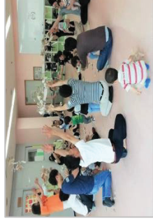
パパひろばの様子

発足当初は、父親の子育て参画を促進し、母親の育児負担を軽減する活動が中心でしたが、現在は、父親支援にとどまらず、「夫婦になる・親になる・家族になる」をコンセプトに親が親となる支援事業を展開、夫婦・家族の絆づくり、コミュニティの活性化にも貢献しています。