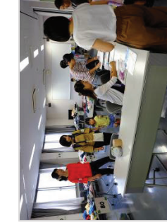
「子供用品交換会」 の様子

また、子育て当事者自身が欲しいと思う情報を、自ら子育て支援サイトで発信することにより、多くの市民がサイト運営に関する仕組みができ、情報提供のツールが増え、サイトへのアクセス数も順調に推移しています。