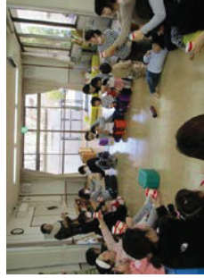
「居場所づくり支援」の様子