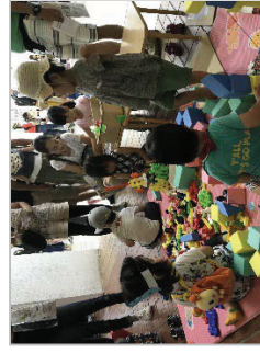
「キッズカーニバル」 の様子