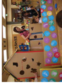
「親子の仲間作り」 の居場所づくり支援の様子

その結果、平成19年には京都府あげぼの賞、平成22年には京都府子育て支援表彰を受賞し、平成28年には、京都府内で広域的に子育て支援に積極的に取り組む団体を認証する「京都府子育て支援団体認証制度」で認証を受けているなど、広く取組が評価されています。